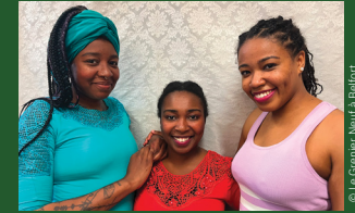
© Le Grenier Neuf à Béfort

Ven 27 MARS 20h30 | Durée 1h05 Tout public dès 15 ans Tarif plein 15€ Tarif réduit de 1 à 10€